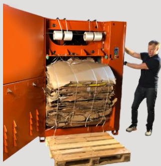
Stlačením dvoch tlačiek vysuniete balík!