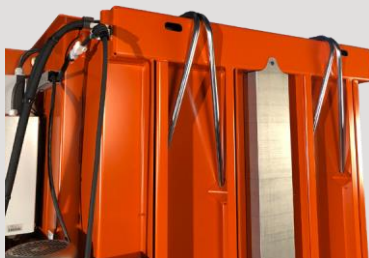
Rúrky na ľahšie viazanie

Tento model prichádza s krížovým valcom a ponúka extra kompaktný dizajn a inštaláciu výšku len 2000 mm. Malá výška zjednodušuje prepavu na miesto inštalácie a poskytuje široké možnosti umiestnenia lisu.