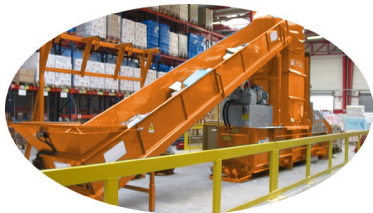
Option: conveyor belt