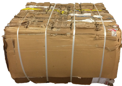
hutný balík do papierní

Uzamykací systém „západka a koliesko“ na spodných dverách umožňuje operátorovi postupne kontrolované otvárať dvere aj pri zhutňovaní expandujúcich materiálov.