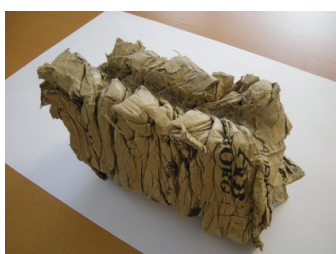
Malá a kompaktná briketa